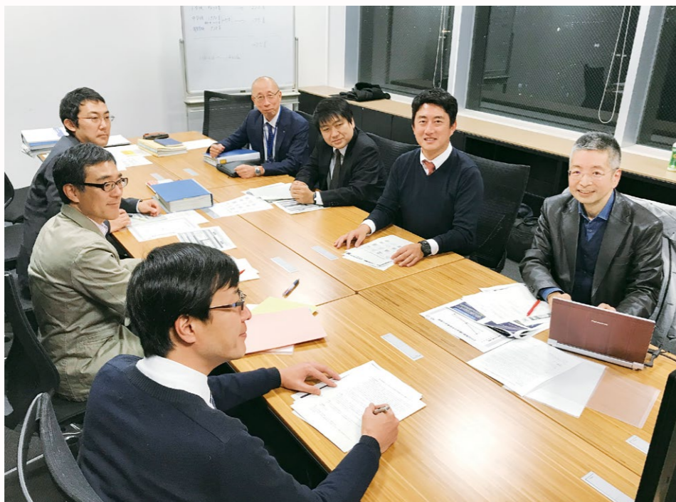
尼崎市での打ち合わせ

実際、「第3期教育振興基本計画」では、客観的な根拠を重視した教育政策を推進することが明記されています。ところが、実際の教育現場では、データはあるのですが、教育の効果測定できるような形に整理されていないことが多いのです。また、教育の効果測定するには、短期的な効果だけではなく長期的な効果を測ることが重要です。しかし、日本ではそのようなデータはなかなか存在しません。研究者自らが調査をしたり、既存の情報をう