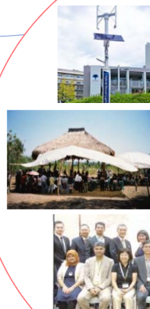
SDGs指標の改善を通じた環境サステナビリティの促進