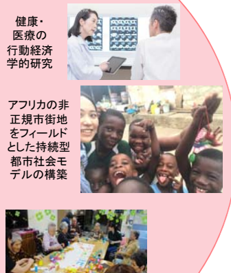
地域住民の死生観と健康自律を支える超高齢社会創生のための文理融合プロジェクト